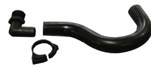
TRAMPA DE CONDENSADOS