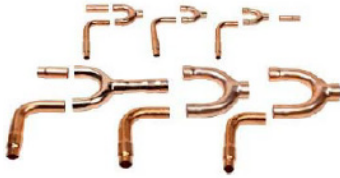
Branch Condensadora Distribuidores de Refrigerante R-410A para condensadoras