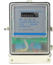
DTS634 / DT636 Medidor digital control, para consumo de energía