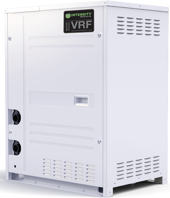
*Imágenes con fines ilustrativos.